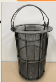
SUSメッシュフィルター