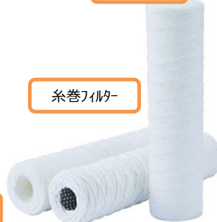
糸巻きフィルター