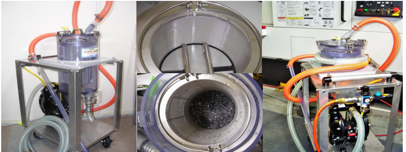
〈スラッジバキューマー外観〉